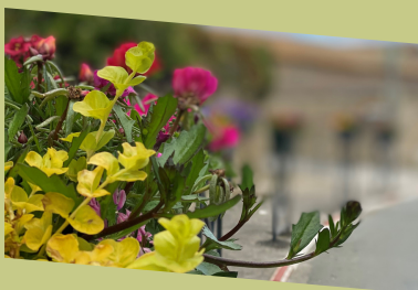
P4 : ENVIRONNEMENT - BIEN VIVRE À FLOURE