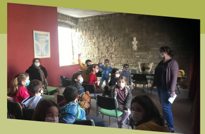
P6 : JEUNESSE - EDUCATION - SENIORS