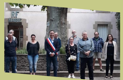
P9: LE MOT DES ELUS