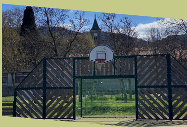
P7: TOURISME - PATRIMOINE - EVENEMENTS