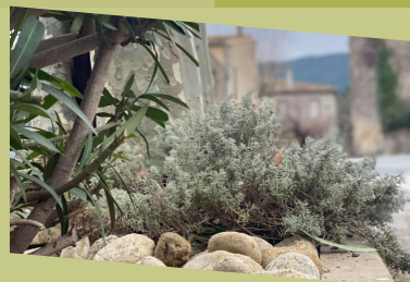
P5 : TRAVAUX - VOIERIES - ENTRETIENS