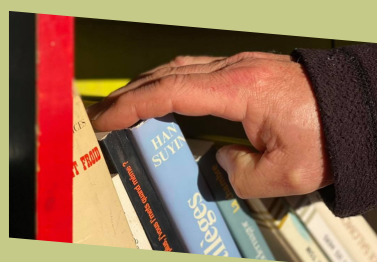
P8 : CARNET NOIR - À SAVOIR